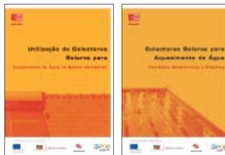
Capas das brochuras sectoriais.

Estão ainda em fase de elaboração, duas outras brochuras sectoriais, uma sobre a utilização de colectores solares para aquecimento de água na indústria e outra sobre os serviços de venda de água quente.