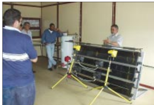
Aspecto de uma das acções de formação no INETI.

Transitoriamente, os candidatos podem solicitar a emissão do respectivo CAP com base em certificados relativos a cursos de formação considerados adequados pela DGE, independentemente das suas habilitações, ou candidatar-se à certificação pela via da experiência, respectivamente, até seis meses ou um ano, após a entrada em vigor deste diploma. O CAP de Técnico(a) Instalador(a) de Sistemas Solares Térmicos será válido por um período de cinco anos. A renovação do CAP estará dependente da manutenção das competências, através da actualização científica e técnica, obtida pelo preenchimento cumulativo de um conjunto de condições, durante o período de validade do CAP.