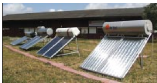
Mostra Tecnológica no Campus do INETI.

critiva do mesmo. Esta ficha apresenta informação detalhada sobre as características técnicas do equipamento e da empresa que o comercializa em Portugal, sendo da inteira responsabilidade dos organizadores da Mostra. Qualquer outro material informativo sobre os equipamentos distribuído no mesmo local é da exclusiva responsabilidade dos fabricantes. As fichas de equipamentos constituem a Mostra Virtual, disponível nos sites www.aguaquentesolar.com e www.spes.pt .